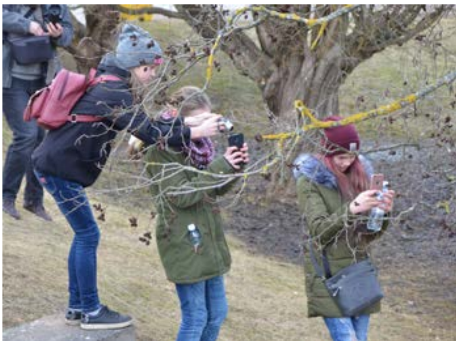
FOTO PRIEKI SALDUS PILSĒTĀ

Saldus novads kopā ar savām sadraudzības pilsētām Vācijā, Francijā un Polijā aktīvi gatavojas Eiropas dienas svinēšanai 9. maijā.